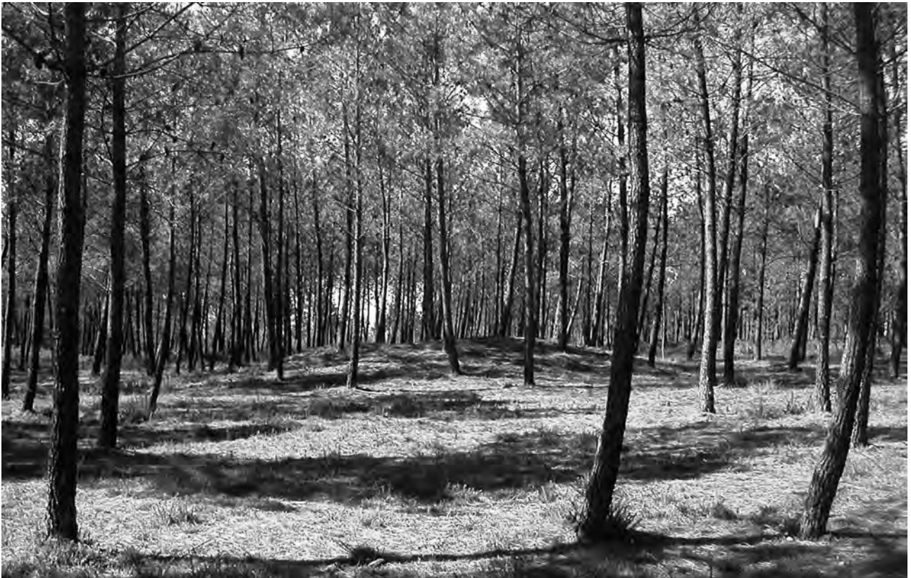
Dos vistas de "Mámoas" o túmulos megalíticos en Monte Penide (Redondela)