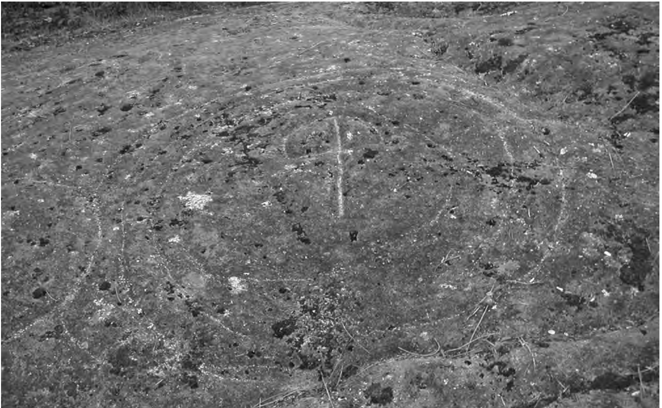
Detalle del petroglifo de Pedra Moura en Fragoselo (Vigo). La agresión humana hacia el grabado prehistórico es evidente y continua