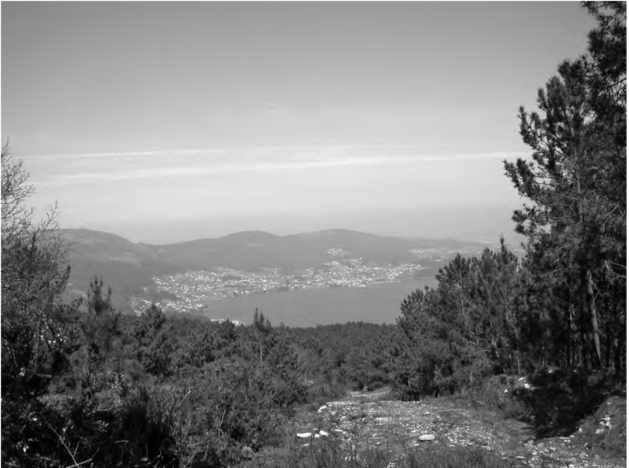
Vista del Valle Miñor desde el yacimiento arqueológico de Monte Alba (Valladares, Vigo). Primero castro y luego fortaleza medieval, la posición estratégica de este enclave es evidente. Domina la entrada de la ría de Vigo.