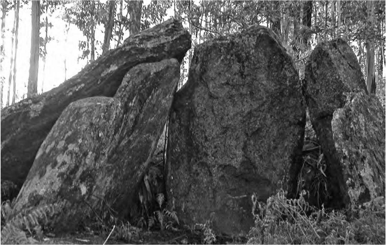
Lámina funeraria de A casa dos noivos (Candeán, Vigo)