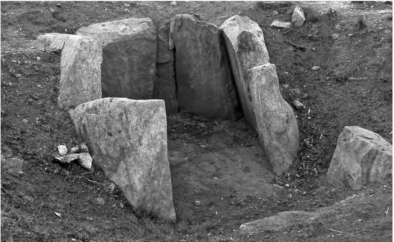
Dolmen recientemente excavado en Costa Freiría (Candeán, Vigo). Estribaciones de la gran necrópolis megalítica del monte Penide (Redondela)