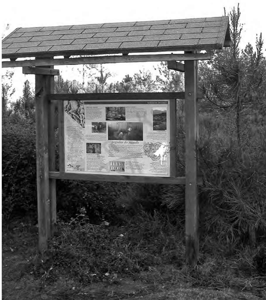
Panel principal de la ruta arqueológica por Candeán

También por último, recordar que se extremen las medidas de vigilancia y control en esta bien señalizada zona arqueológica pues uno de los grandes problemas que plantea la divulgación de nuestro rico patrimonio cultural es que va a marcar e indicar con precisión el punto vulnerable sobre el que pueden actuar personas que de modo furtivo y totalmente al margen de la ley dañen de forma irreparable alguno de estos monumentos arqueológicos.