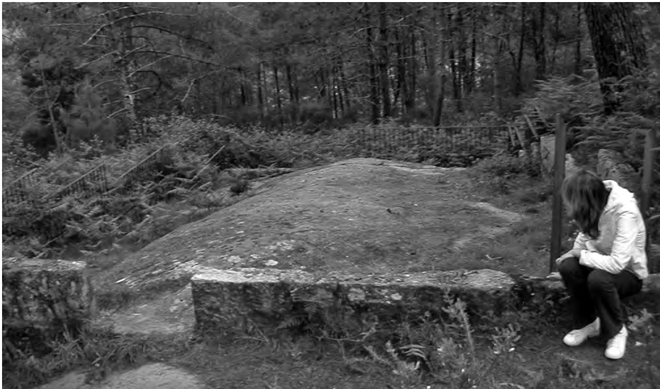
Petroglifo Pedra Moura (Fragoselo, Coruxo, Vigo). Primer petroglifo protegido y señalizado en el Ayuntamiento de Vigo. Hoy está totalmente abandonado