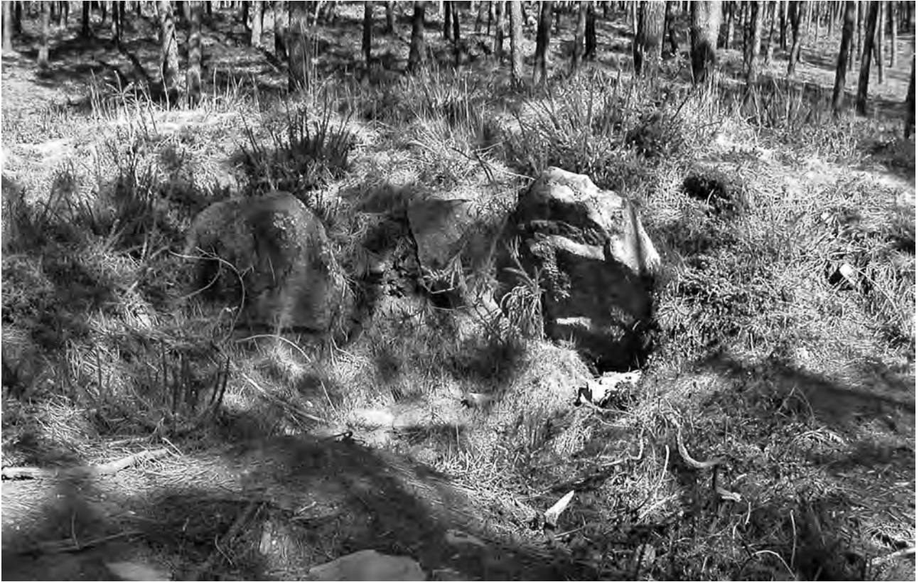
Restos de una cámara funeraria megalítica en Monte Penide