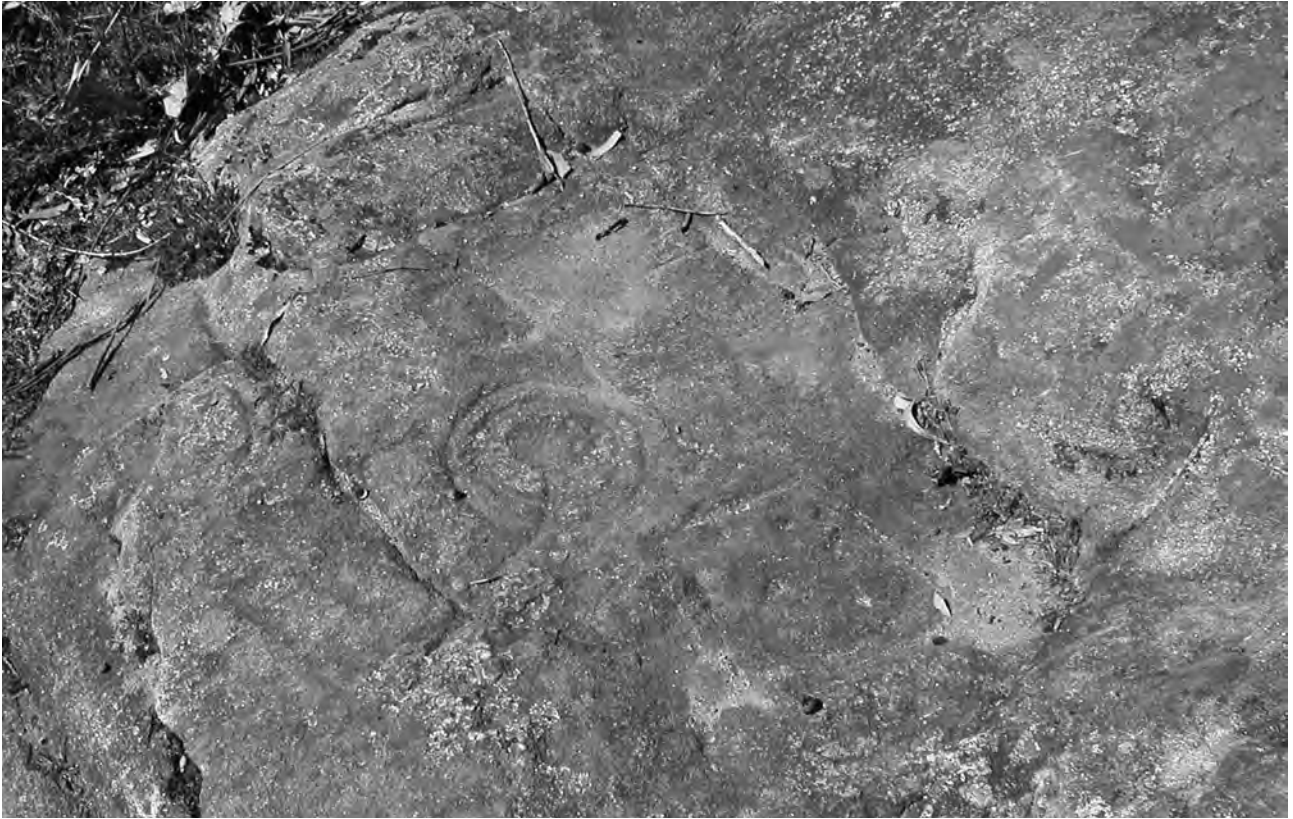
Petroglifo de Monte Penide (Redondela)