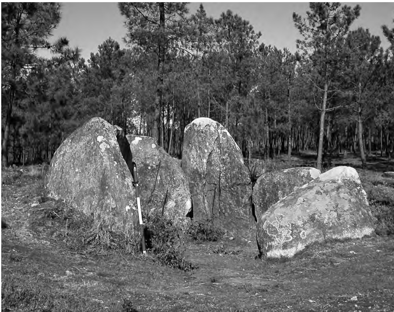
Mámoa do Rei. Monte Penide (Redondela)

Para terminar esta tarea sería más eficaz si se contase con el apoyo institucional oportuno y, a ser posible, también del privado, pues aunando todos ellos se lograrían, mejor y en menor tiempo, los objetivos de proteger y difundir el patrimonio cultural, en este caso, el arqueológico existente en los montes comunales de Vigo.