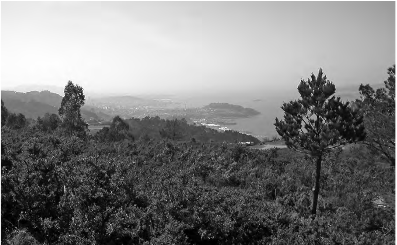
Vista de la Ría de Vigo desde Monte Penide (Redondela)