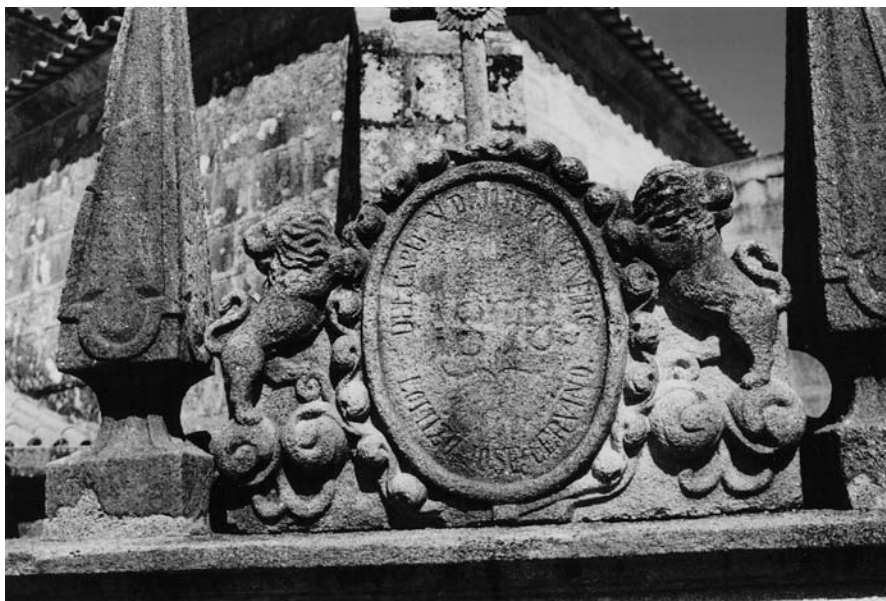
Óvalo, no que se pode apreciar na parte baixa: "LO HIZO JOSE CERVIÑO". Mausoleo do capitán Lopo, no camposanto de Aguasantas (Cotobade).

dende o ano 1922, no que aconteceu o seu pasamento.