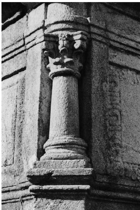
Detalle dunha das columnas que limitan o sarcófago exento polas esquinas, no que se aprecia sensiblemente a diminución do fuste na parte alta. Mausoleo do capitán Lopo, Aguasantas (Cotobade).

lelos hai que adiviñalos, sobre todo os referentes ás unidades e decenas, que son realmente os que sitúan o monumento que Xosé Cerviño García fixo para o capitán Lopo Piñeiro no contexto da historia local de Aguasantas e no catálogo productivo do autor. Por esta causa, de non levarmos unha escaleira, seríamos incapaces de proporcionar tanto a data correcta que está a sinalala feitura do devandito panteón coma o resto do letreiro.