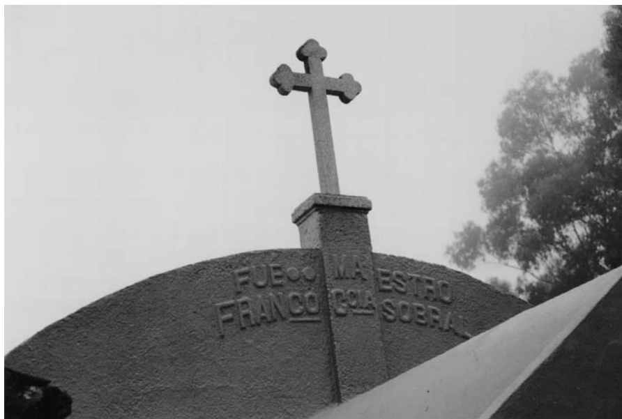
Parte posterior da sepultura do mestre Francisco García Sobral que aparece asinada polo seu artífice. Data do ano 1929. Camposanto de Carballedo (Cotobade).